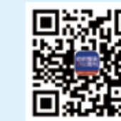
纺织服装周刊 新浪微博