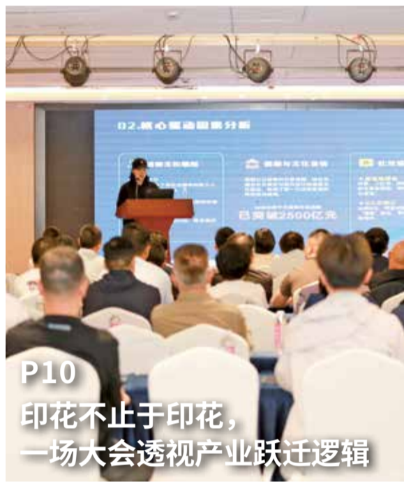
P10 印花不止于印花， 一场大会透视产业跃迁逻辑