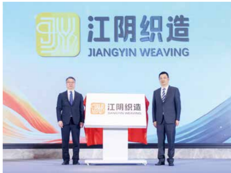
大会为针织产业全链路提质增效探索新路径。