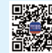
纺织服装周刊 今日头条号