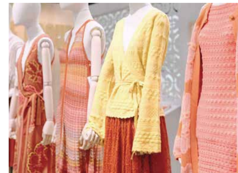
康赛妮以坚守立命、以匠心致远。

以硬核品质为底气，康赛妮在全球市场阔步前行。“四五”期间，企业坚持国际国内双循环、外销内销双引擎，在亚、欧、美多地设立分支机构，搭建覆盖全球时尚核心区的代理体系，形成“直营+代理+分支机构”的立体化全球营销网络。面对贸易摩擦、疫情冲击、消费变局等多重挑战，康赛妮团队无畏前行，将产品、品牌与文化推向世界舞台。