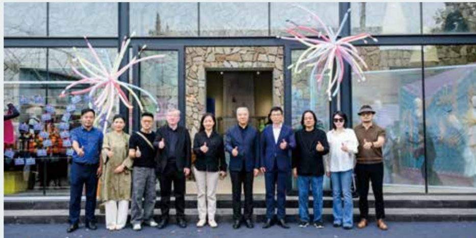
领导、嘉宾为巡展剪彩。

在服装设计教育普遍面临“院校培养与产业需求错位”的困境下，一个持续三十年、不断迭代的赛事平台，实际上承担了“产教融合缓冲带”的功能。学生通过参赛提前接受市场逻辑与专业评判，企业通过赛事发现人才，院校则通过反馈闭环调整教学。这种三角关系，比单纯的教学改革更具实操性。