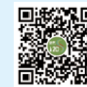
纺织 120S 微信视频号