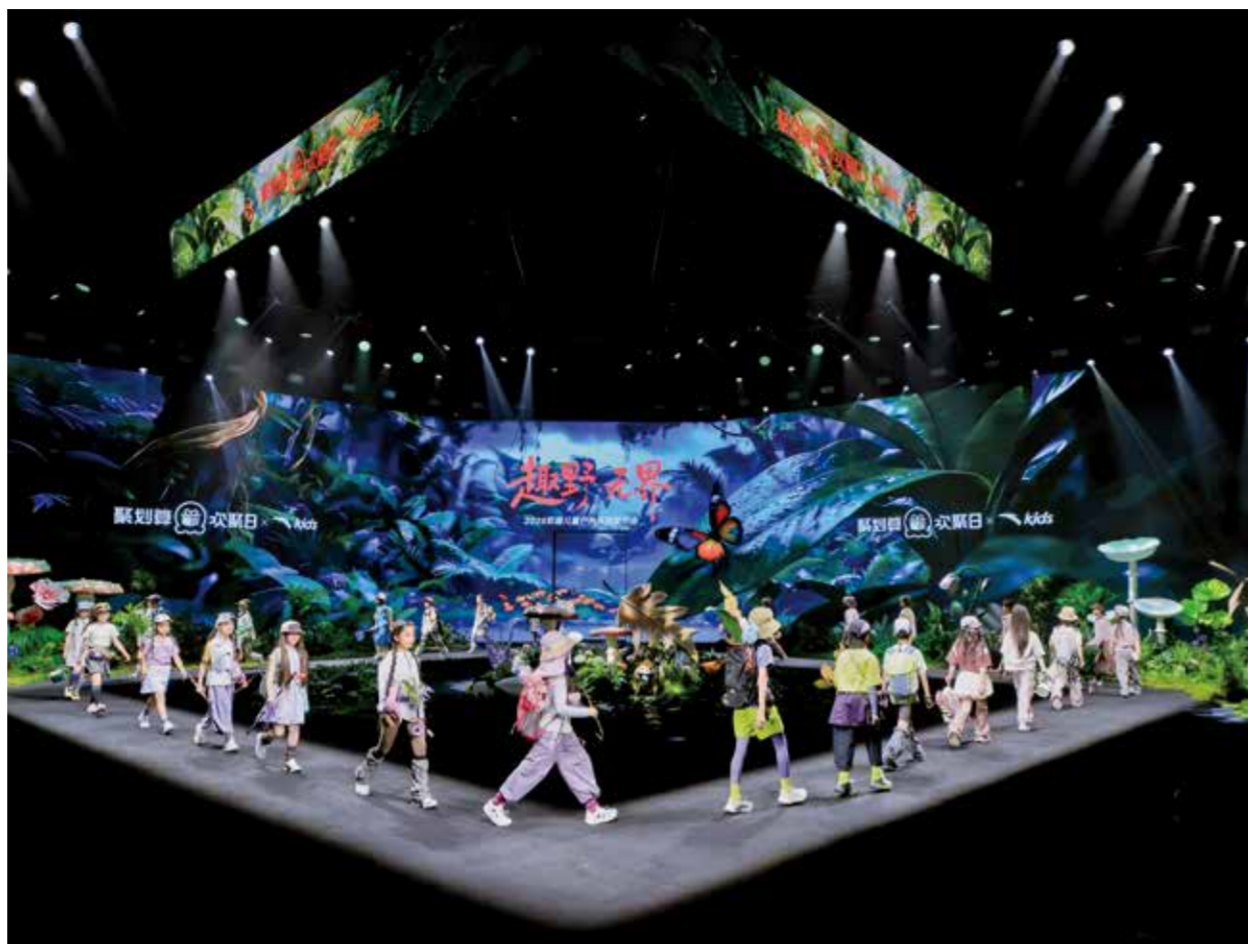
如今的柯桥处处有时尚，步步皆潮流。