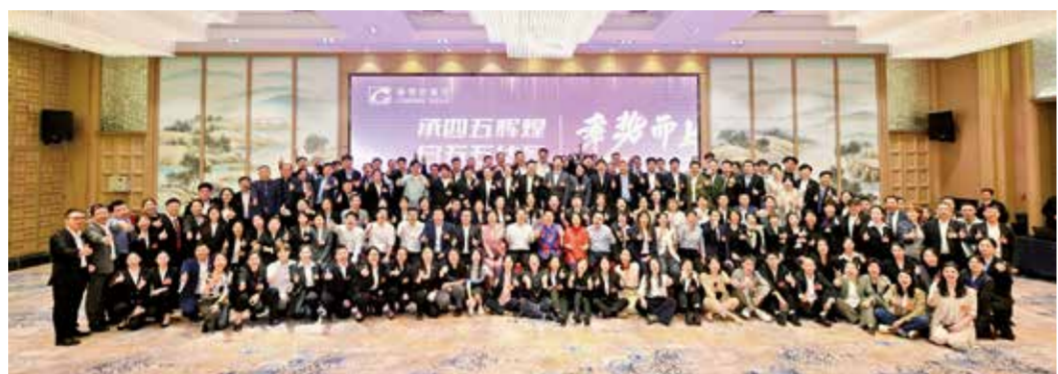
康赛妮用匠心与创新铸就中国奢侈品全球竞争力。