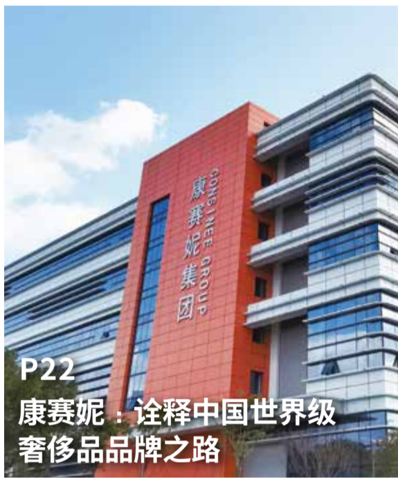
P22 康赛妮：诠释中国世界级 奢侈品品牌之路