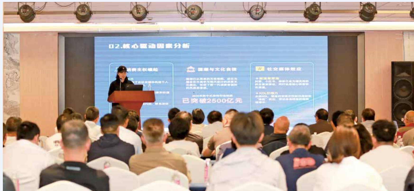
大会着力探寻从工艺突破到系统协同的进阶路径。