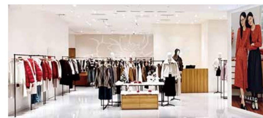
玖姿安娜蔻线下门店。

循迹，是追随都市女性多元生活的轨迹；漫游，是从钢筋水泥的通勤日常，到精致惬意的轻社交时刻，再到奔赴山海的休闲假日。三种看似彼此撕扯的生活状态，在一季服装中实现了无缝的日常转译。