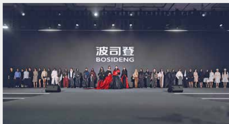
波司登带来时尚盛宴。

数字化转型上，波司登以AI赋能“研产供销服”全价值链提质增效，以数智化赋能产业创新升级。“BSD.AI美学大脑”构建起从设计构思到虚拟成衣交付的数字化闭环，将头样开发时间从100天压缩至27天，样衣开发成本降低60%以上。