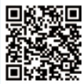
纺织服装周刊 网易号