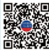
纺织服装周刊 微信视频号