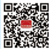
纺织机械 微信公众号