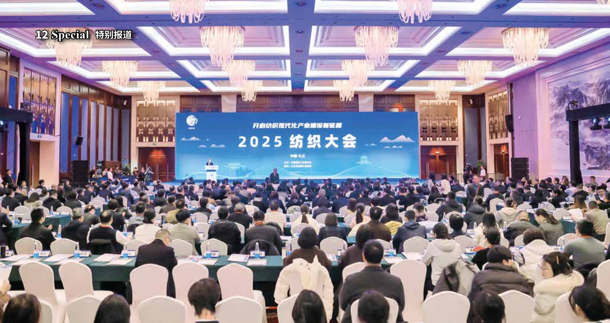
大会全方位讨论了产业现代化进程中的关键议题。