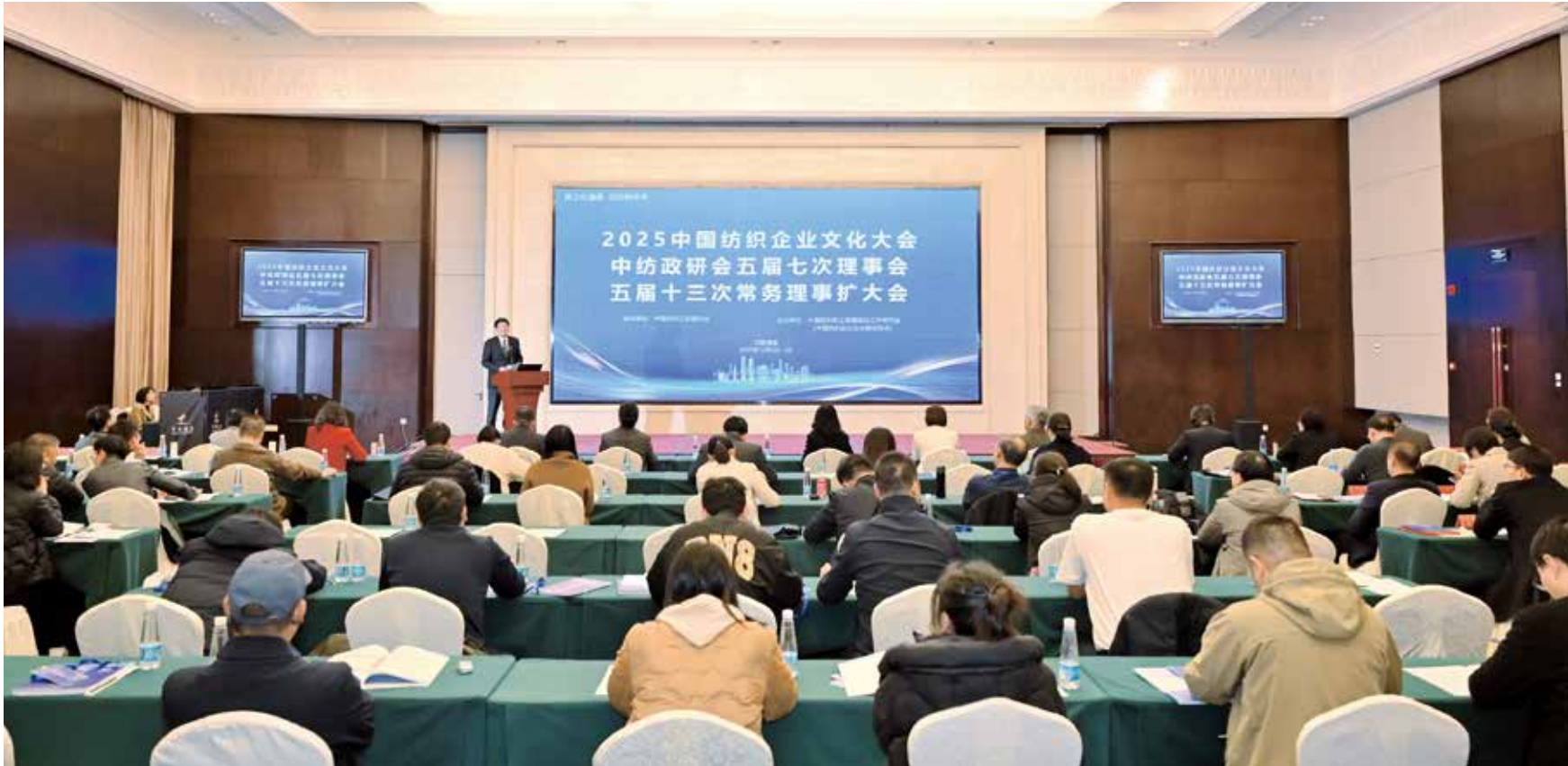
大会研究部署了纺织行业“十五五”宣传思想文化和软实力工作。