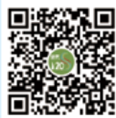
纺织 120 秒 微信视频号