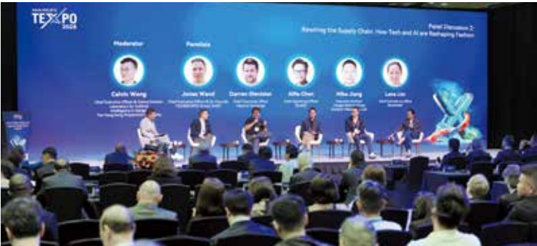
这场规模空前的“集体行动”将“韧性共识”转化为构建更灵活、更创新、更可持续供应链的具体路径。