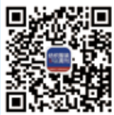
纺织服装周刊 微信公众号