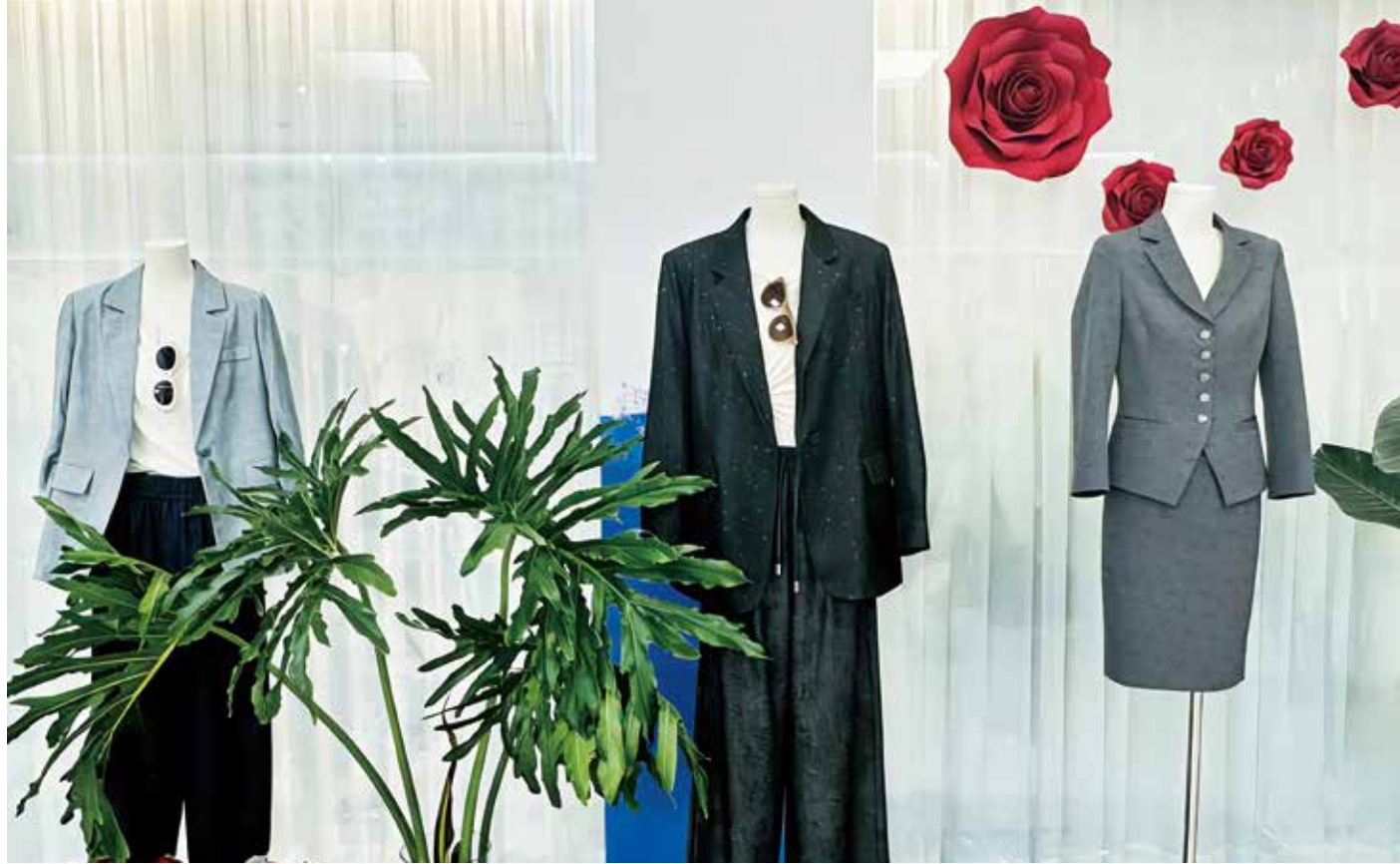
柯桥正以细分领域的深度突破，为传统产业的高质量发展书写生动注脚。