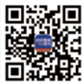
纺织服装周刊 新浪微博