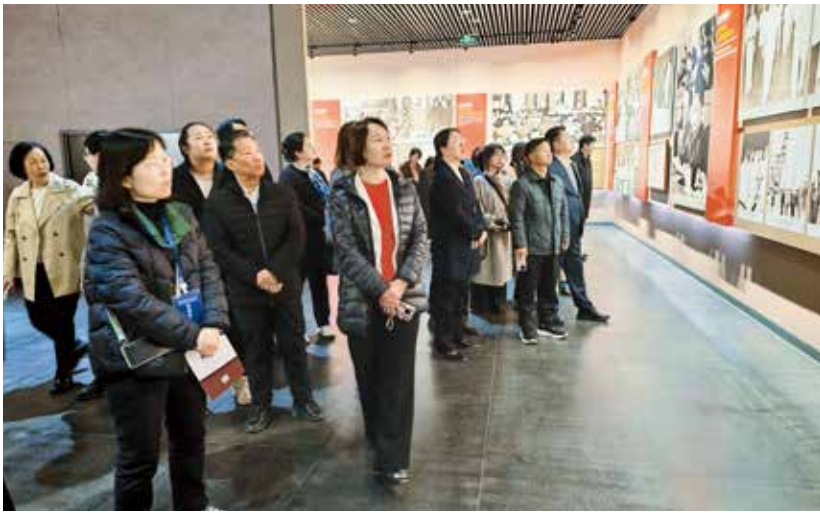
与会代表走访学习。

从根植百年积淀，孕育“九绳管理法”；践行“三绳九法”，推动管理全面落地；收获实践成果，彰显行业价值几个方面进行了分享。青岛海丽雅集团以生产扎头绳起家，专注特种绳缆及装备研发生产百年。集团创新提出“九绳管理法”，安全之绳，筑牢企业发展“防护网”；专业之绳，打造行业创新“领航舰”；厚德之绳，编织企业人文“同心圆”，为企业高质量发展注入了活力。