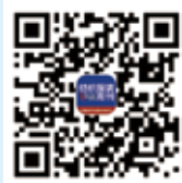
纺织服装周刊 今日头条号